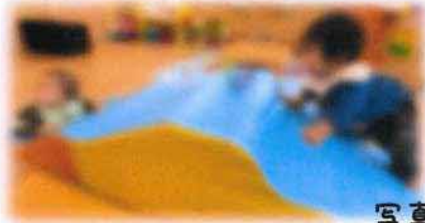
写真は、園の0歳児さんの様子

這い這いの手や足の使い方、物の握り方、ボールの投げ方、物などを引っ張る力の入れ方、手をあげて物を掴む、距離感を考え掴むなど