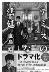
『テミスの不確かな法廷 再審の証人』 直島 翔/著

雪国の風物や綺談を綴った江戸時代のベストセラー『北越雪譜』刊行までの40年にわたる数奇な道のりを描いた本格時代長篇！