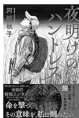
『夜明けのハントレス』 河崎 秋子/著

札幌の大学生・マチが出会った狩猟の世界。新人ハンターとして歩みはじめた彼女は、命を撃つことに葛藤しながらも成長していく。