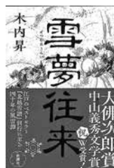
『雪夢往来』 木内 昇/著

札幌の大学生・マチが出会った狩猟の世界。新人ハンターとして歩みはじめた彼女は、命を撃つことに葛藤しながらも成長していく。