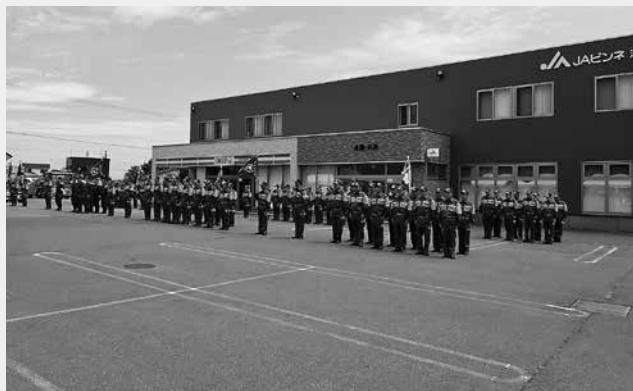
※令和7年 第34回砂川地区広域消防組合連合消防演習の様子