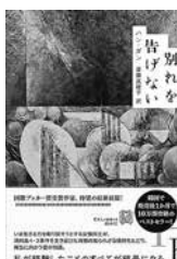
『別れを告げない』 ハン・ガン/著

世界的振付師・久我一臣。バレエ団の来日記念企画の連載記事の取材を受けた彼が語ったのは、壮絶な戦争体験だった。過酷な運命の中、人々はいかにして希望を見出すのか――。