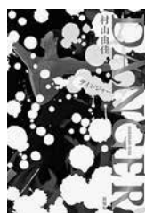
『DANGER』 村山 由佳/著

世界的振付師・久我一臣。バレエ団の来日記念企画の連載記事の取材を受けた彼が語ったのは、壮絶な戦争体験だった。過酷な運命の中、人々はいかにして希望を見出すのか――。