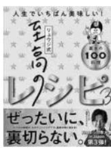
『リュウジ式至高のレシピ3 人生でいちばん美味しい! 基本の料理100』 リュウジ/著

料理レシピ本大賞 in Japan 大賞受賞作、待望の第3弾! 普段の料理が至高の料理に進化する裏技満載の一冊。