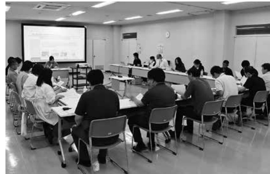
【職員まちづくり推進懇談会の様子】

町民有志意見書の共有、運営方法の検討 住民と農商工業者の連携、提供コンテンツ 農産物直売部門の冬季営業 活用できる補助金や財源