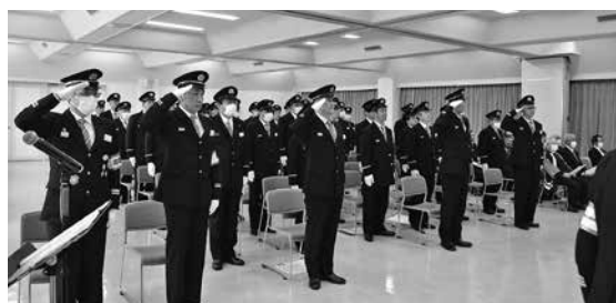
※令和7年浦臼消防出初式の様子