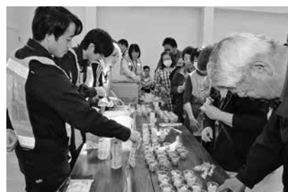
【防災備蓄品（非常食）の試食】