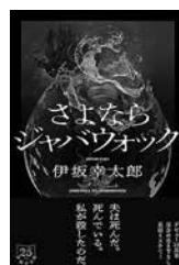
『さよならジャバウォック』 伊坂 幸太郎/著

女性が理系の教育を受ける機会に乏しい時代に、科学の道を志した猿橋勝子。戦前、戦中、戦後の激動の時代を科学者として生きた彼女の生涯とは…。