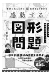
『難解に見えるのに超気持ちよく解ける 感動する図形問題』 まさし/著

ある頃から別人のように冷たくなった夫。彼からの暴言に耐え続ける中、ついに暴力をふるわれた。そして今、夫は死んでいる。私が殺したのだ…。