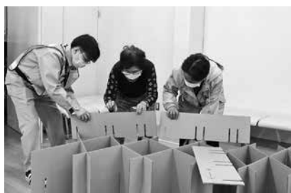
【段ボールベッドの組み立て】