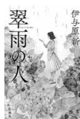
『翠雨の人』 伊与原 新/著

女性が理系の教育を受ける機会に乏しい時代に、科学の道を志した猿橋勝子。戦前、戦中、戦後の激動の時代を科学者として生きた彼女の生涯とは…。