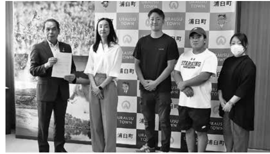
【みんなの声会議より意見書受領】

道の駅関係者意見交換会参加の町民有志が主体となり道の駅を考える会を2回実施し、9月4日に町へ意見書の提出がありました。今見えている課題と今後への期待を含め「浦臼の魅力伝える」道の駅になってほしいという願いが込められた意見書であり今後の協議や整備に活用していきます。