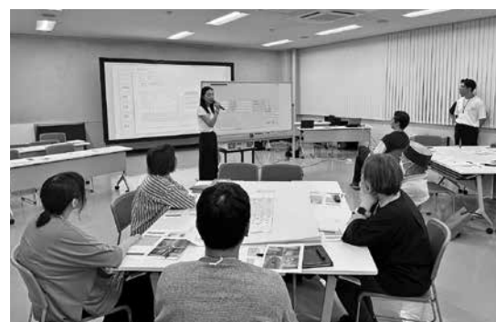
【町民ワークショップの様子】