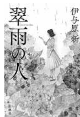
『翠雨の人』 伊与原 新/著

女性が理系の教育を受ける機会に乏しい時代に、科学の道を志した猿橋勝子。戦前、戦中、戦後の激動の時代を科学者として生きた彼女の生涯とは…。