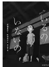
『いるのいないの』 京極 夏彦 ほか 作

各地のコビトの生態は現地の 環境に根付いている。その土地 の自然や名産品、産業、お祭り などの様々な文化を楽しく知る ことができます。