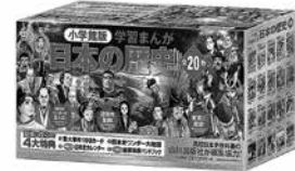
小学館版学習まんが日本の歴史20巻セット/史実 に忠実に・つながる年表、図解がいっぱい。