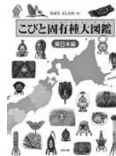
『こびと固有種大図鑑 東日本編』 なばと したか 作

各地のコビトの生態は現地の 環境に根付いている。その土地 の自然や名産品、産業、お祭り などの様々な文化を楽しく知る ことができます。