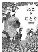
『ねことことり』 たての ひろし/さく なかの 真実/え

おかしくも悲しくもある庶民の日常生活を描いた、アメリカの短編の名手ヘンリーの13作の傑作厳選集