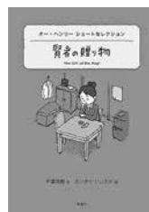
『賢者の贈り物』 オー・ヘンリー/作

おかしくも悲しくもある庶民の日常生活を描いた、アメリカの短編の名手ヘンリーの13作の傑作厳選集