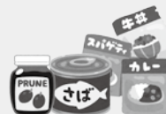
缶詰・レトルト食品