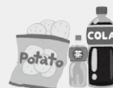
お菓子・ジュース類