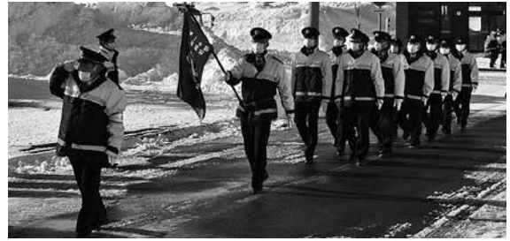
※令和5年出初式の様子