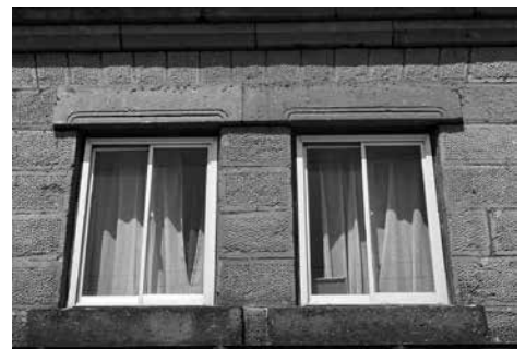
写真② 2階の縦長窓 かつては上げ下げ窓でした。 装飾されたまぐさが載っています。