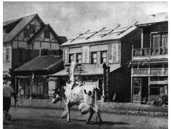
写真① 昭和20年代の太田勉強堂