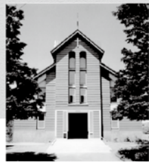
◀会堂の竣工時写真