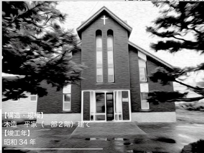
【構造・規模】 木造 平家（一部2階）建て 【竣工年】 昭和34年