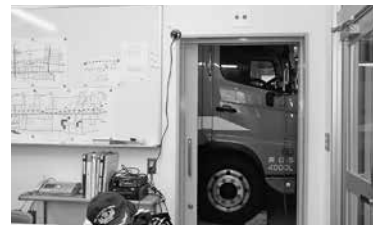
会議室から車庫への出入り口