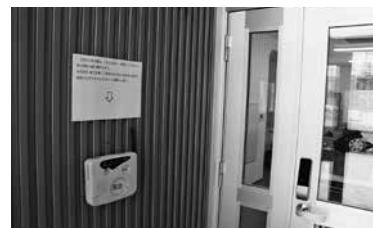
正面出入り口の緊急通報ボタン