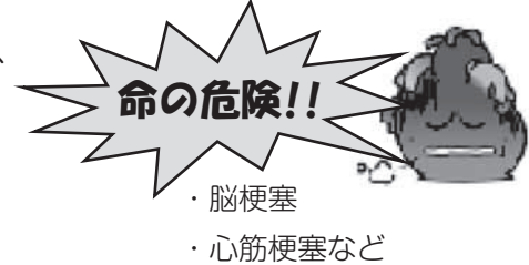
▽死因別死亡率順位 (H27年)

日本人の死因の上位を占めているのが、 生活習慣病 が原因の疾患です。右記の表をみると、浦臼町においても同じであることがわかります。生活習慣を見直すことで、これらの病気による死亡を防ぐことができると考えられます。しかし、生活習慣病は「沈黙の病」と言われ、自覚症状があらわれないことが多く、症状が出現した時にはすでに重症化している可能性があるのです。そのような、気がつきにくい生活習慣病を、早期に発見することができるのが 特定健診 です。