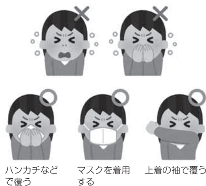
ハンカチなどで覆う

咳などの症状がある方は、咳やくしゃみを手でおさえると、その手で触ったドアノブなど周囲のものにウイルスが付着し、ドアノブなどを介して他者に病気をうつす可能性がありますので、咳エチケットを行ってください。持病がある方などは、公共交通機関や人混みの多い場所を避けるなど、より一層注意してください。